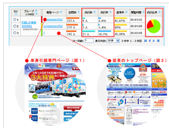
※ ログイン後測定結果画面